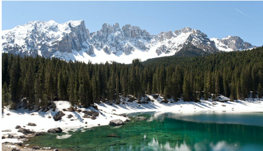
Karersee, Tirol del Sur, Italia

Después de 3 años en el laboratorio trabajando con las organizaciones más expertas del mundo, tanto en tecnología geoespacial (Agencia Espacial Europea) como en dinámica de la nieve (The WSL Institute for Snow and Avalanche Research SLF), en 2020 Wegaw lanzó el primer SaaS de monitorización de la nieve basado en datos de satélite. Desde entonces, la startup ha ofrecido con éxito datos que se crean a partir de datos satelitales y una combinación única de algoritmos de machine learning. Por ejemplo, el siguiente mapa de baja resolución de datos de SWE , demuestra estos resultados de Wegaw de un grupo de cuencas hidrológicas en Valais, Suiza: