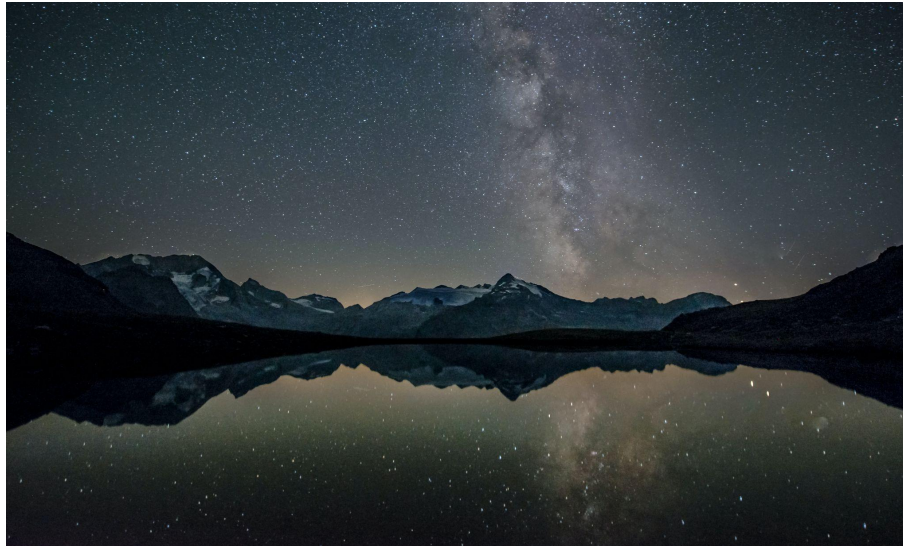
Alpes Zillertal, Tirol del Sur, Italia, tomada por Eberhard Grossgasteiger (Fuente: Unsplash )

“El sector energético está explorando de forma proactiva formas de equilibrar la volatilidad de los precios y la generación de energía, impulsada principalmente por la incertidumbre en la producción de energías renovables. Gracias a nuestra capacidad de observación detallada, remota y casi en tiempo real, podemos ayudar a optimizar la producción de energía y el trading de energía. Este proyecto, en particular, nos permite dar mayores pasos en los Alpes europeos y mejorar nuestra validez en la región.”