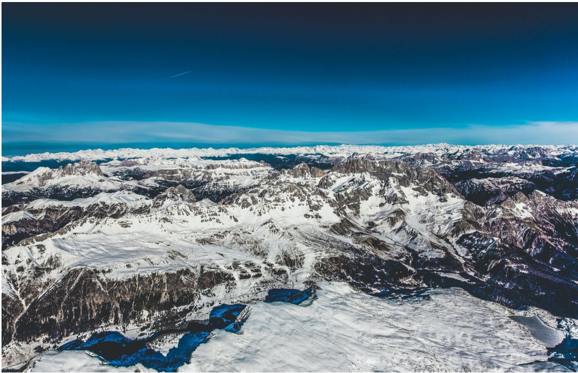
Región alpina del Tirol del Sur en Italia tomada por Markus Spiske (Fuente: Unsplash )

La empresa suizo/española pionera en tecnología climática, Wegaw, ha obtenido la oportunidad de realizar un estudio de viabilidad técnica para la equivalencia de agua en nieve para construir una solución escalable de previsión y predicción de generación de energía para un grupo de centrales hidroeléctricas en el norte de Italia.