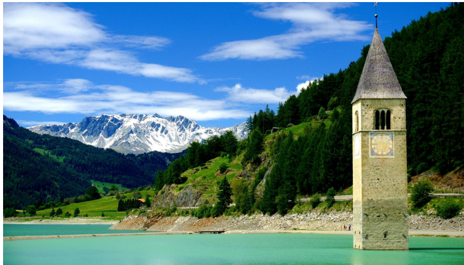
Campanario abandonado (Kirchturm) en la antigua ciudad de Altgraun en Curon Venosta, Italia. Un hermoso monumento bajo protección monumental que se encuentra cerca de una central hidroeléctrica.

“Nuestro equipo está muy orgulloso de trabajar con Wegaw y la ESA en la optimización de la transición hidroenergética y estamos deseando ver los resultados de nuestra colaboración muy pronto.”